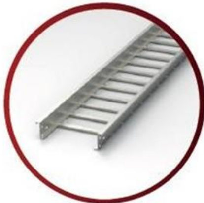
Bandeja Tipo Escalerilla

Bandeja Tipo Escalerilla Cal.18 (1.10mm) Referencia por medidas (mm)